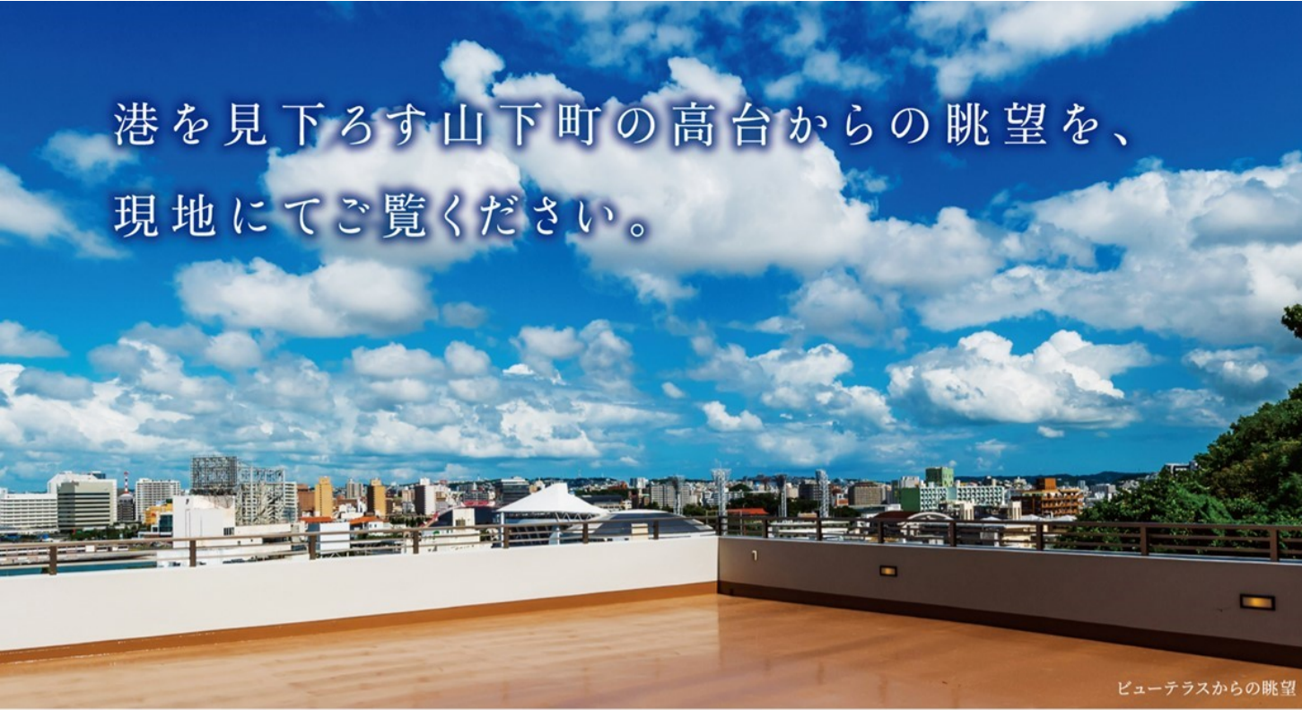
ビューテラスからの眺望